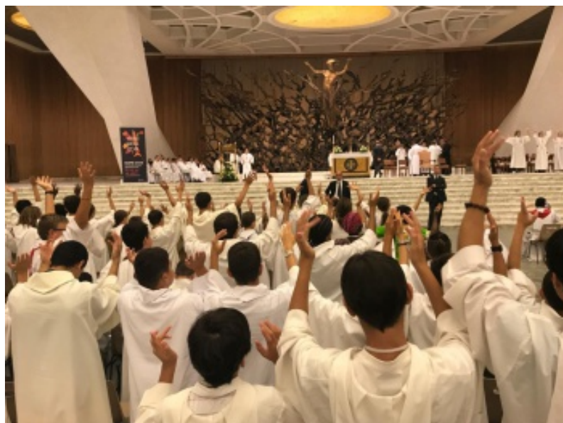
26/08 : Messe à l'Aula Paul VI