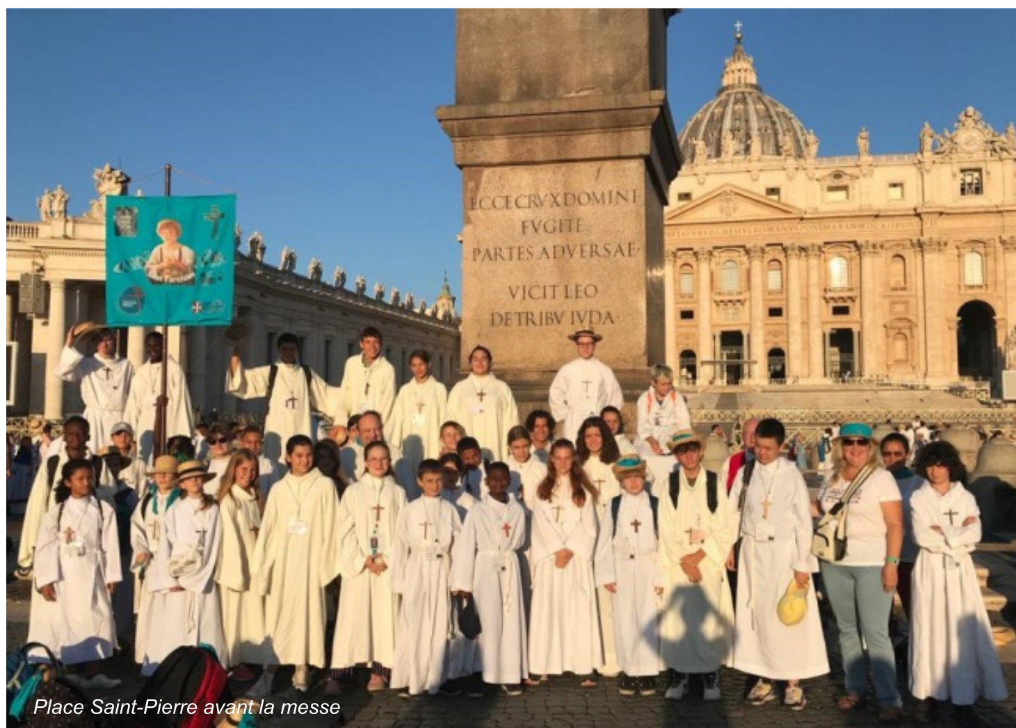
Place Saint-Pierre avant la messe