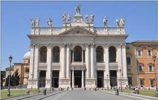
23/08 : Catéchèse et messe à Saint-Jean-de-Latran

Le programme a été dense à plusieurs niveaux. Spirituellement, les jeunes ont assisté chaque jour à un temps de catéchèse et participé à une messe . Et physiquement, nous avons parcouru en moyenne 20 km à pied par jour . Les jeunes ont découvert des lieux emblématiques dans l'histoire du catholicisme, avec les basiliques majeures de Saint-Jean-de-Latran, Sainte-Marie-Majeure, Saint-Paul-hors-les-Murs, ou encore Saint-Pierre. Ces lieux étaient de belles invitations aux chants et à la prière pour les 2500 servants venus de toute la France. Nous avons eu aussi la chance d'être hébergés chez les sœurs Pallotine, juste à côté de la place Saint-Pierre. Nous nous y sommes sentis comme chez nous tant leur accueil a été chaleureux.