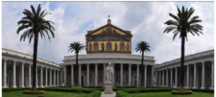
24/08 : Journée rallye vers Saint-Paul-hors-les-Murs

Le vendredi 26 août , les jeunes ont été accueillis à la basilique Saint-Pierre avant la messe dans l'Aula Paul VI. A l'issue de la messe, ils ont assisté à l' audience du Pape François (cf pages 8-9). Durant cette magnifique rencontre, ils ont été touchés par ses paroles qui étaient au plus près de leur réalité de jeunes chrétiens : Quelle est la place de Dieu dans ma vie ? Comment faire quand presque aucun de mes copains n'est chrétien et quel rôle puis-je avoir à leurs côtés ? Est-ce qu'en dehors de la messe je continue à être un serviteur de Dieu ? Un éclairage sur leur vie qui leur a